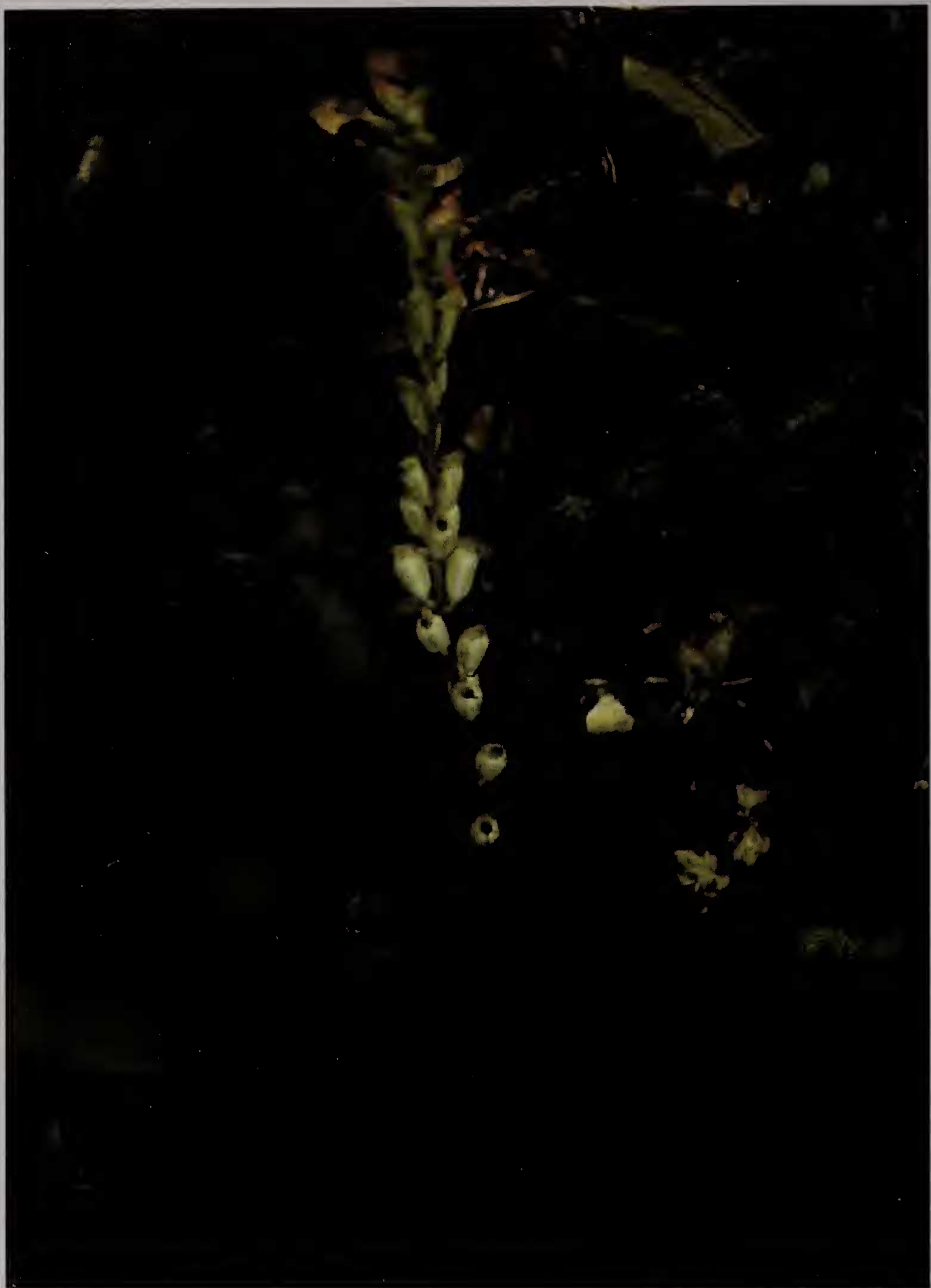
Fig. 2 : Wulfschlaegelia aphylla in situ